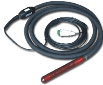
VAF36 - VAF60-1